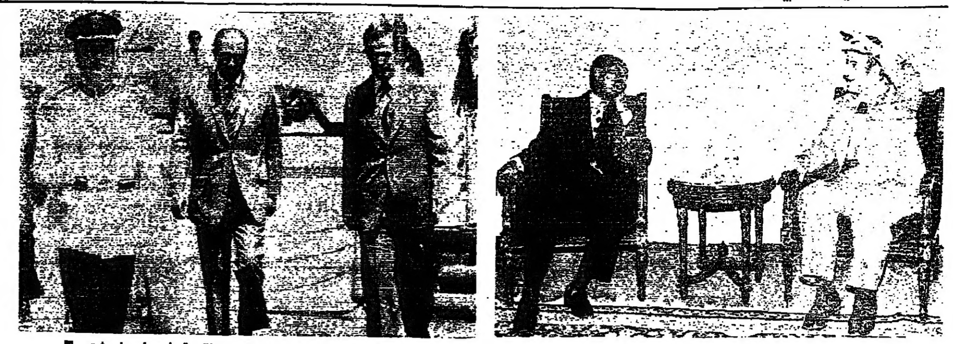
الرئيسان السادات والاسد لدى اجتماعهما أمس